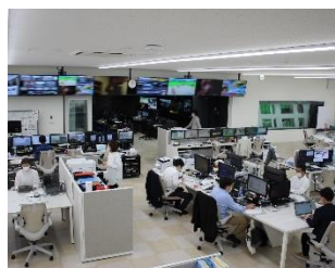
2階報道制作フロア